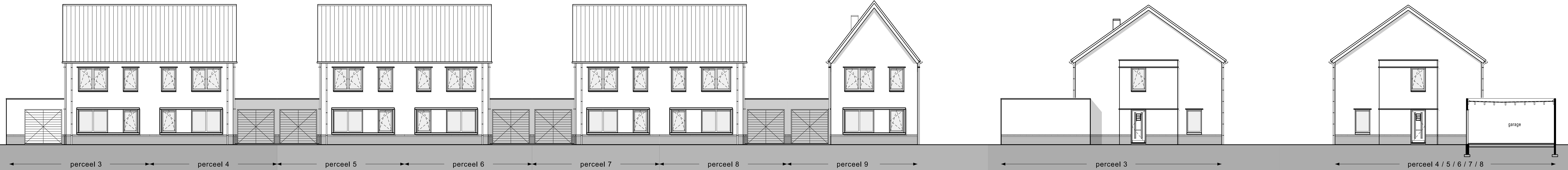
VOORGEVEL (schaal 1 :100)